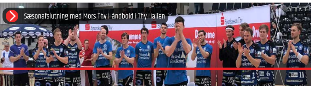
Sæsonafslutning med Mors-Thy Håndbold i Thy Hallen