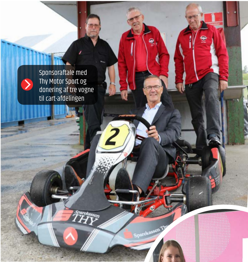
Sponsoraftale med Thy Motor Sport og donering af tre vogne til cart-afdelingen