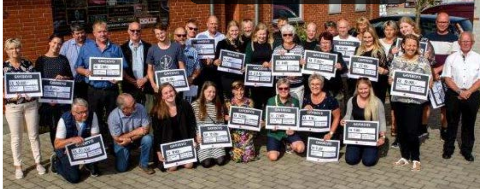
Hunstrup-Østerild Sparekasses Fond uddelte 576.609 kr. til 29 legatmodtagere