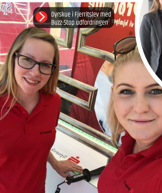
Dyrskue i Fjerritslev med Buzz-Stop udfordringen