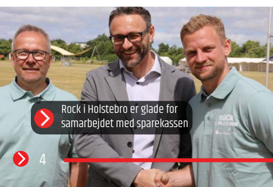
Rock i Holstebro er glade for samarbejdet med sparekassen