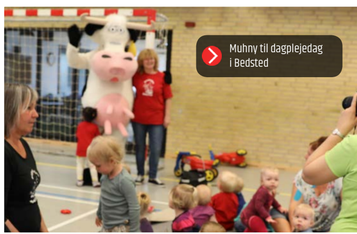
Muhny til dagplejedag i Bedsted